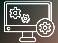
Monitoring as a Service