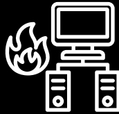
Disaster Recovery As a Service